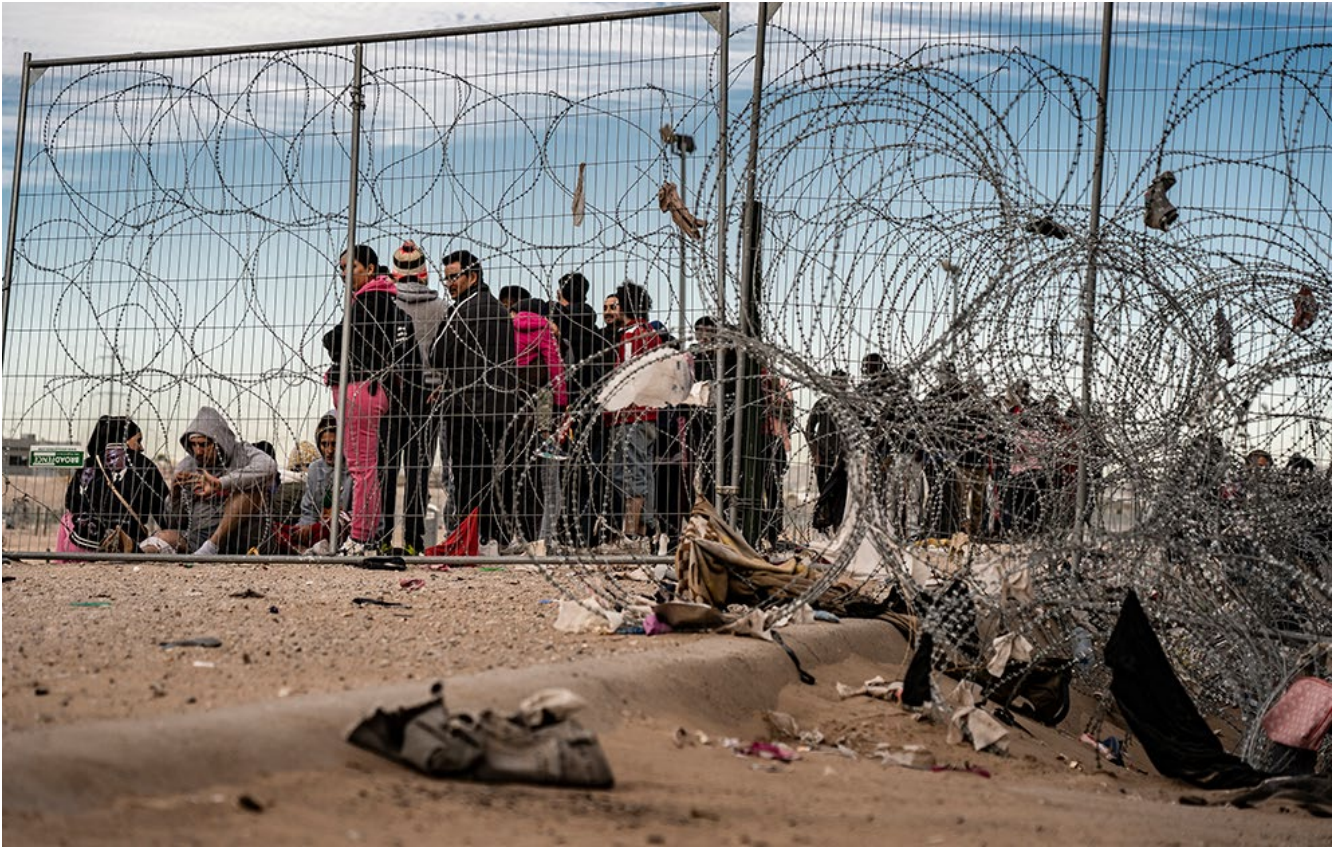
El artículo “Las puertas falsas de la migración a Estados Unidos” aborda los cruces más utilizados en la frontera con Estados Unidos. Marzo, 2024. Foto y artículos: DUILIO RODRÍGUEZ, en Pie de Página .

en recuperar la soberanía energética y en recuperar el control estatal sobre el mercado eléctrico. Hay una transferencia de subsidios directos hacia sectores desfavorecidos: jóvenes, tercera edad, con capacidades diferentes. Aunque es muy significativo el aumento de los salarios mínimos, los salarios profesionales crecieron mucho menos: un maestro de educación básica pública gana solamente 2.2 salarios mínimos.