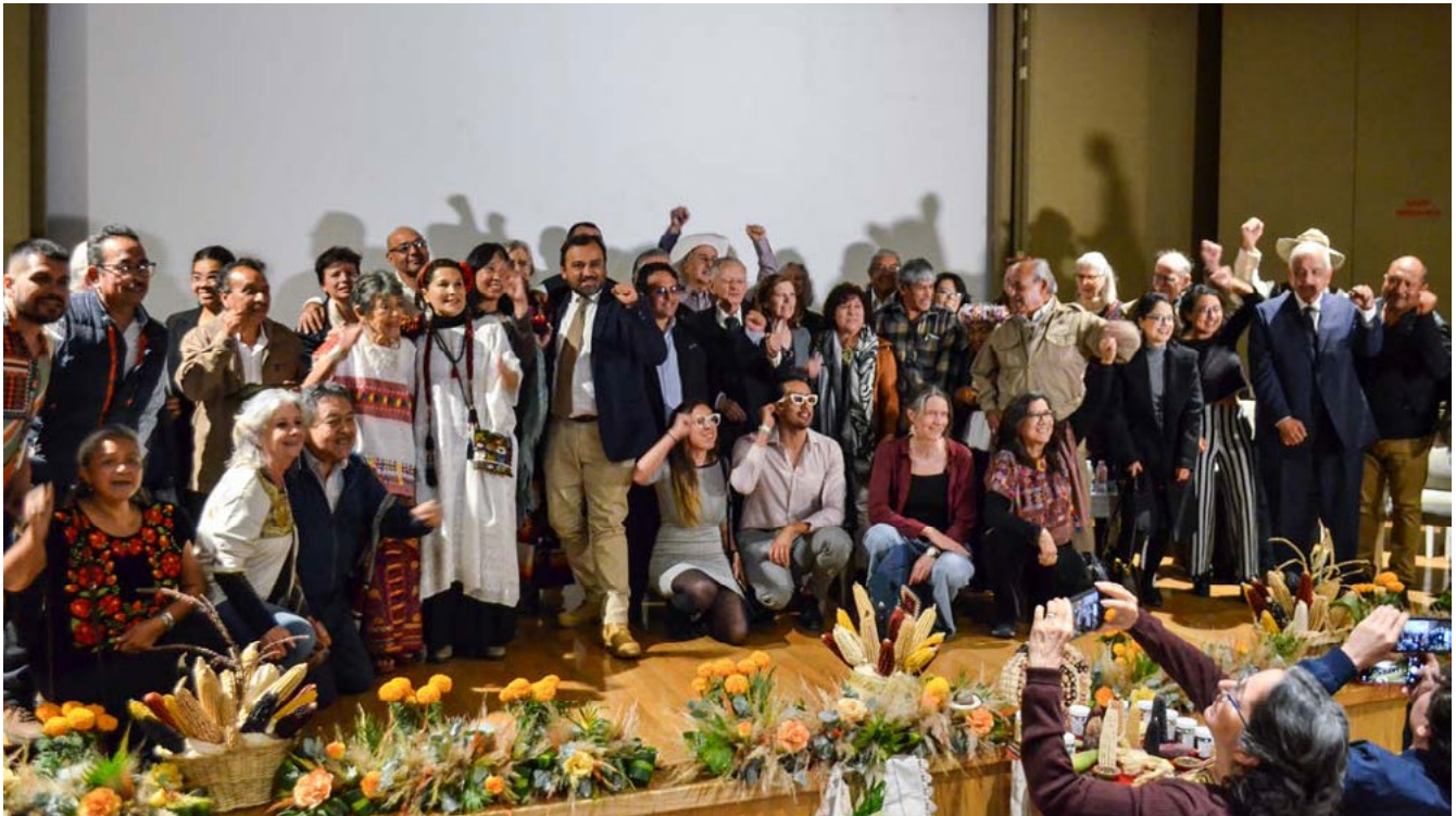
“¿Qué sería de México sin nuestro maíz?”. En 2023 se cumplió una década de acción colectiva contra el maíz transgénico y por la defensa del maíz nativo. Museo Franz Mayer, Premio Pax Natura.

—Entrevista realizada el 9 de abril de 2024 en CDMX.