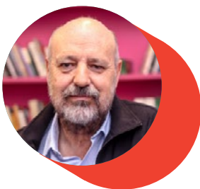
Periodista y autor. Coordinador de la sección de Opinión de La Jornada .