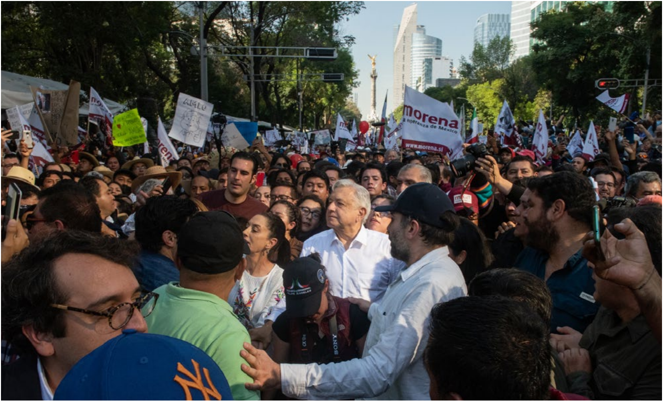
Marcha por los cuatro años de gobierno de AMLO, sábado 27 de noviembre de 2022, tras la realizada quince días antes en defensa del Instituto Nacional Electoral.

del aparato del Estado y hacia la gente. Yo creo que Claudia va a hacer un mejor gobierno que Andrés, porque una parte de las grandes aventuras infraestructurales ya está en marcha. Tiene que darles continuidad, pero ya están en marcha. Así que se va a ir liberando dinero para mejorar la calidad en la que el Estado se relaciona con los ciudadanos.